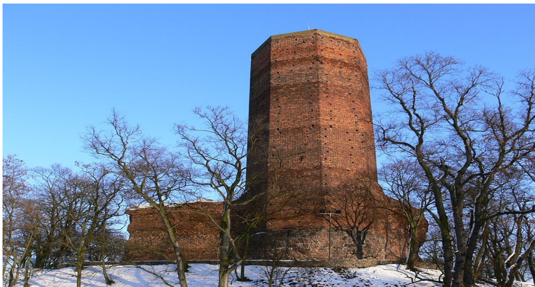
Mysia Wieża w Kruszwicy