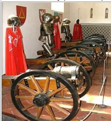
Wystawa muzealna w komnatach zamku w Golubiu - Dobrzyniu