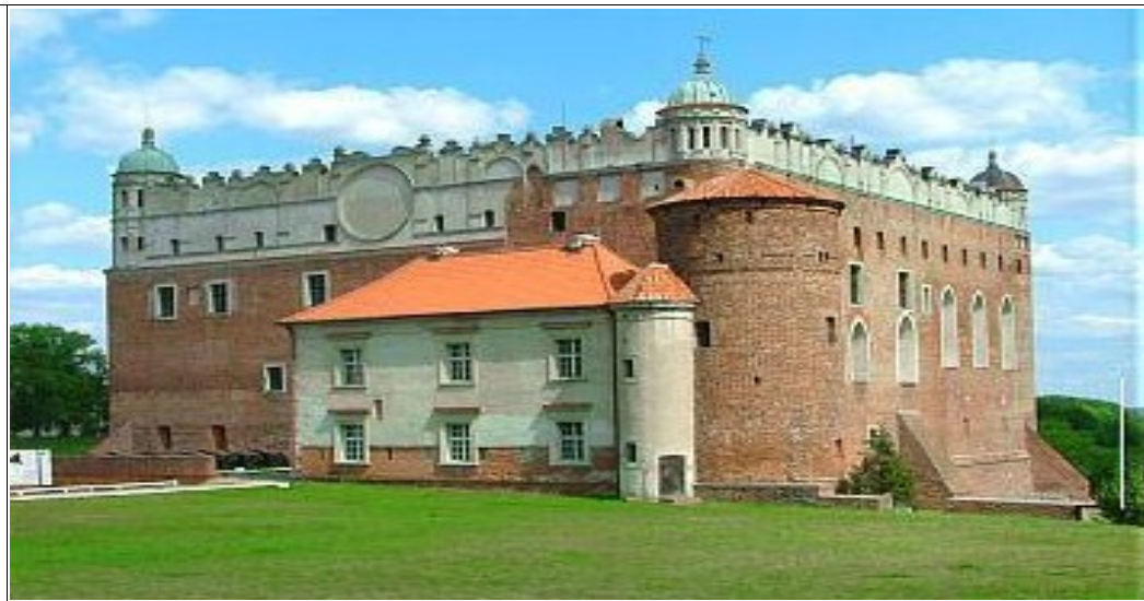
Zamek w Golubiu - Dobrzyniu