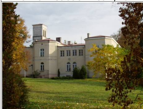
Ośrodek Chopinowski w Szafarni