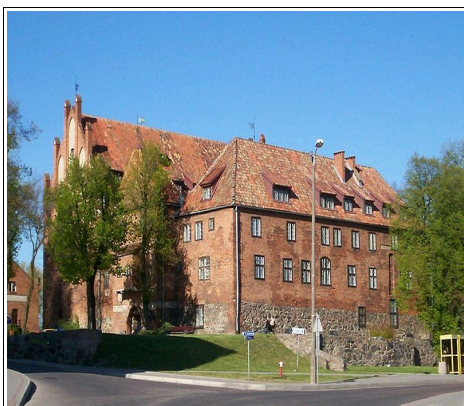
Zamek w Kętrzynie