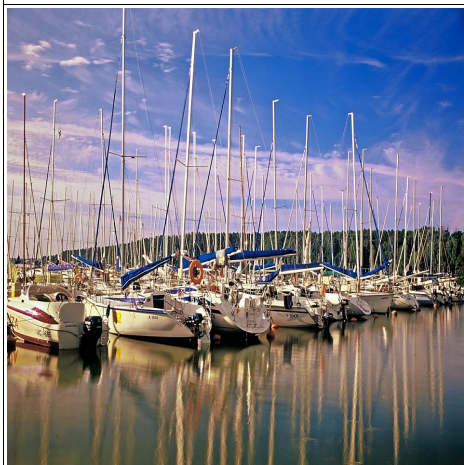
Przystań w Mikołajkach