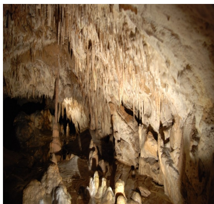
Jaskinia Raj w Chęcinach