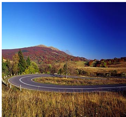
Wielka Pętla Bieszczadzka