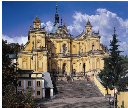
Sanktuarium w Wambierzycach