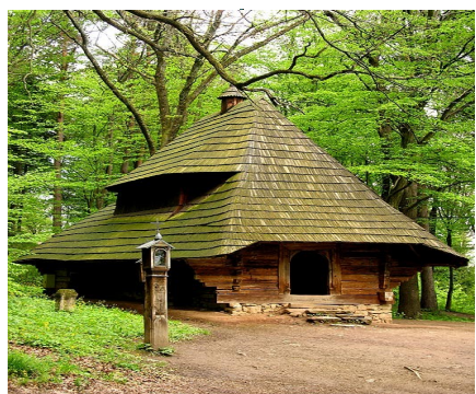
Skansen w Sanoku