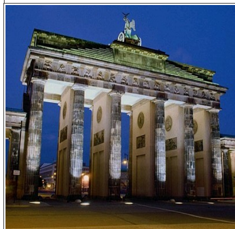
Brama Brandenburska w Berlinie